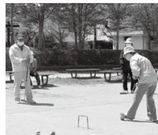
頭も使うスポーツです

健康増進を目的としたシルバースポーツセミナーや区老連主催のゲートボール大会、グラウンド・ゴルフ、ペタンク大会