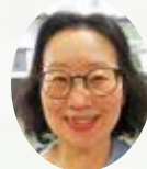
空堀伊達なクラブ