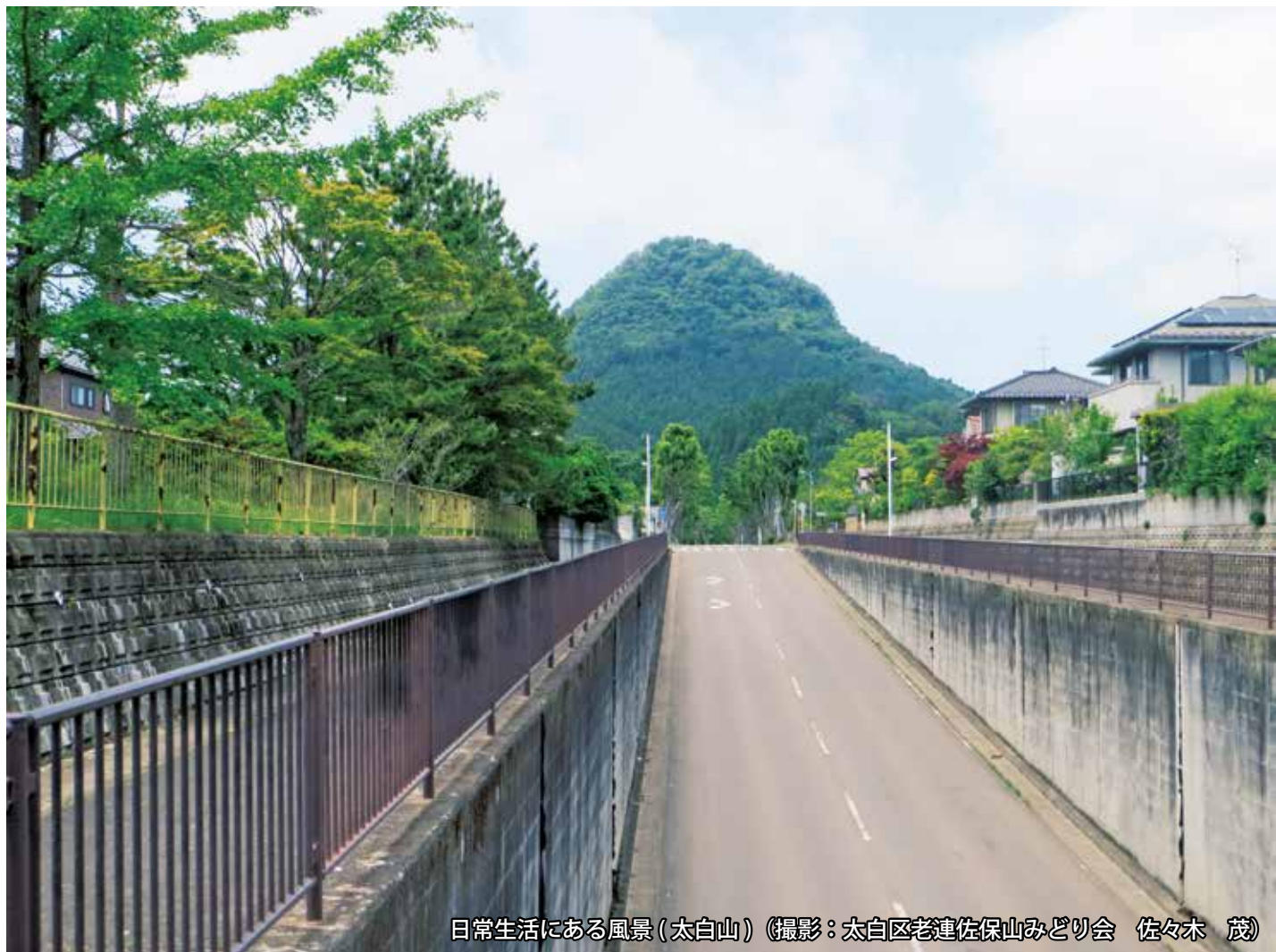
日常生活にある風景(太白山)