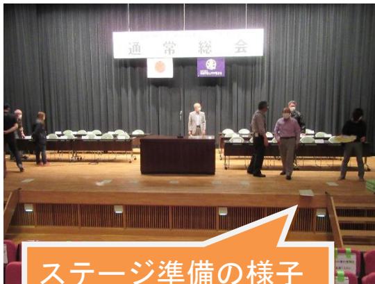
ステージ準備の様子

○長根事務局長から会場・受付・ステージの準備等の説明があり、部員は意識統一しました。