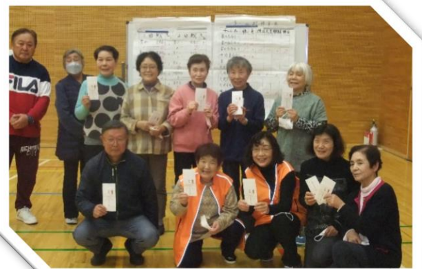
ペタンク大会入賞者