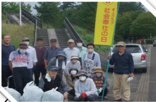
全国一斉社会奉仕の日