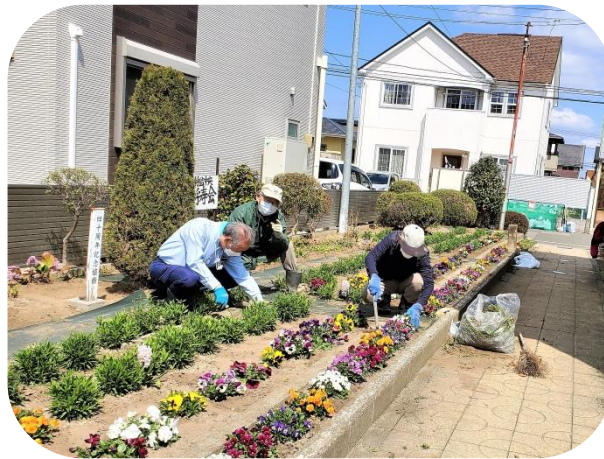
4月3日(月)に実施した中央将寿会花壇の除草作業の様子