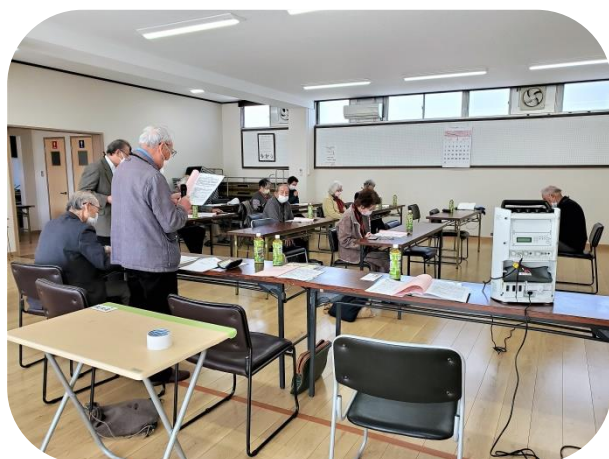
第49回定時総会の事業報告等報告状況 (池田副会長)