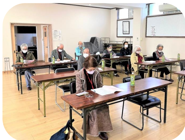
第49回定時総会の会場の様子