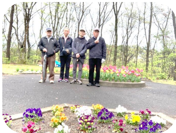
4月16日(日)将監沼コース内にある 将監なごみの会花壇内での写真