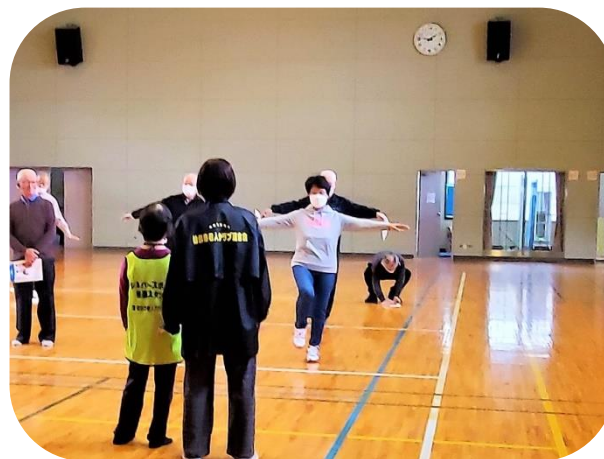
4月18日黒松市民センターで行われた 体力測定の様子(開眼片足立測定)